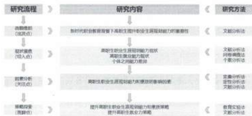
图 2 研究内容与方法

研究思路： 本课题研究思路在广泛搜集相关文献资料和听取专家建议的基础上确定选题，通过探索目前高职学生的职业生涯规划能力现状、个体差异、影响因素等，找出提升高职学生职业生涯规划能力的对策，进而提升就业力，以期给之后的高职职业生涯规划 and 就业指导提供理论和实践支撑。